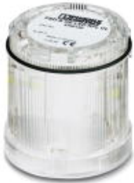
LED random flashing beacon element, 24 V DC, clear

Please be informed that the data shown in this PDF Document is generated from our Online Catalog. Please find the complete data in the user's documentation. Our General Terms of Use for Downloads are valid ( http://phoenixcontact.com/download )