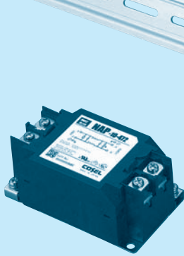
The terminal cover is retracted inside the unit