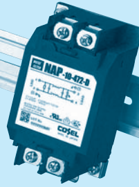
DIN rail installation type is option