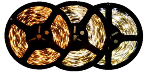
Warm White 3000K Pure White 4200K Cool White 6000K

Inspired LED Flexible Strip Lights are a simple, customizable solution for all of your LED lighting needs. These unique strips can be cut to length and terminated with solderless end connectors for easy DIY installation. Energy efficient, with a wide range of options for brightness and color, LED Flex Strips are the perfect option for any lighting application.