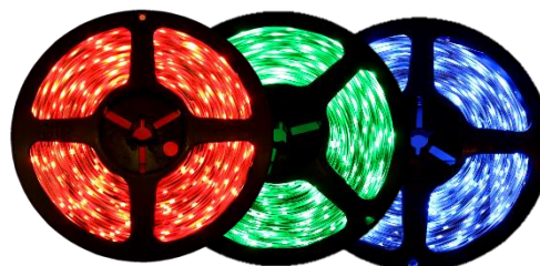
Red Green Blue Available in NB & SB Only NB, SB & UB Only