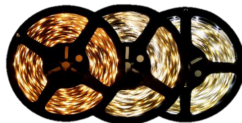
Warm White 3000K Pure White 4200K Cool White 6000K

Inspired LED Flexible Strip Lights are a simple, customizable solution for all of your LED lighting needs. These unique strips can be cut to length and terminated with solderless end connectors for easy DIY installation. Energy efficient, with a wide range of options for brightness and color, LED Flex Strips are the perfect option for any lighting application.