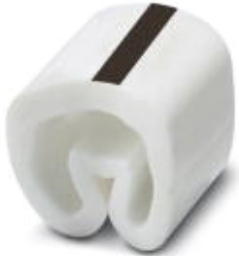
Conductor marking collar, labeled with the symbol: Symbols, white, width: 3.2 mm

Please be informed that the data shown in this PDF Document is generated from our Online Catalog. Please find the complete data in the user's documentation. Our General Terms of Use for Downloads are valid ( http://phoenixcontact.com/download )