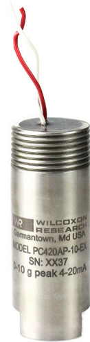
Table 1: PC420Ax-yy-EX model selection guide