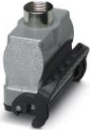
HEAVYCON B16 coupling housing, with single locking latch, height: 70.5 mm, with 1 x Pg21 gland, straight cable outlet

Please be informed that the data shown in this PDF Document is generated from our Online Catalog. Please find the complete data in the user's documentation. Our General Terms of Use for Downloads are valid ( http://phoenixcontact.com/download )