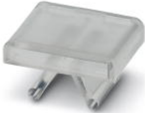
The figure shows a similar product

4-chamber marker carriers, can be optionally labeled with insert strips ES... or 4 snap-in profiles EPB