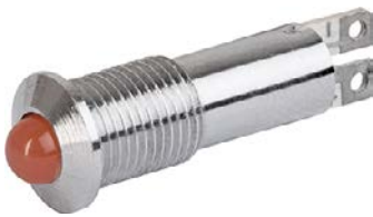
Housing chrome LED red Without pre-resistor with exposed LED and external reflector