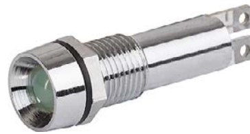
Housing chrome LED green Chalice shape with internal reflector