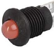
Housing black dull LED red Exposed LED and external reflector