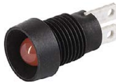
Housing black dull LED red Chalice shape with internal reflector