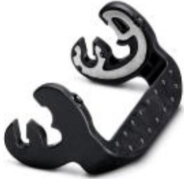
Replacement plastic single locking latch for standard housings of type B10

Please be informed that the data shown in this PDF Document is generated from our Online Catalog. Please find the complete data in the user's documentation. Our General Terms of Use for Downloads are valid ( http://phoenixcontact.com/download )