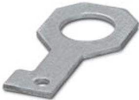
Plate for fixing the FLT-ISG-100-EX isolating spark gap to a flange, drill hole diameter of 42 mm.

Please be informed that the data shown in this PDF Document is generated from our Online Catalog. Please find the complete data in the user's documentation. Our General Terms of Use for Downloads are valid ( http://phoenixcontact.com/download )