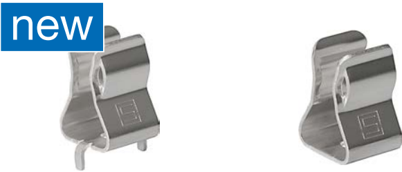
Solder THT version

Heavy Duty Fuse Clip, 10.3 x 38 / 10.3 x 85 mm, 1500 VAC/VDC, 32 A