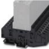
Modular socket element, 2-position, for holding two circuit breakers, each with a single position

Box mounting base - TMCP SOCKET M - 0916589