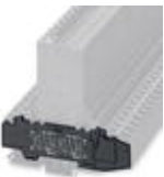
End cover, Length: 115 mm, Width: 6 mm, Color: black