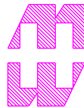
VIEW OF LID (INSIDE)