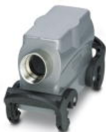
HEAVYCON B10 sleeve housing, with double locking latch, height: 56 mm, with 1 x M20 gland, lateral cable outlet

Please be informed that the data shown in this PDF Document is generated from our Online Catalog. Please find the complete data in the user's documentation. Our General Terms of Use for Downloads are valid ( http://phoenixcontact.com/download )