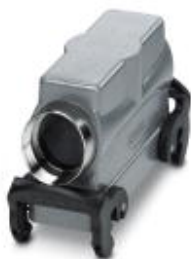
HEAVYCON B24 sleeve housing, with double locking latch, height: 72 mm, with 1 x Pg29 gland, lateral cable outlet

Please be informed that the data shown in this PDF Document is generated from our Online Catalog. Please find the complete data in the user's documentation. Our General Terms of Use for Downloads are valid ( http://phoenixcontact.com/download )