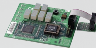
LPC POST Debug Board

Please refer to page 1-46 for detailed information