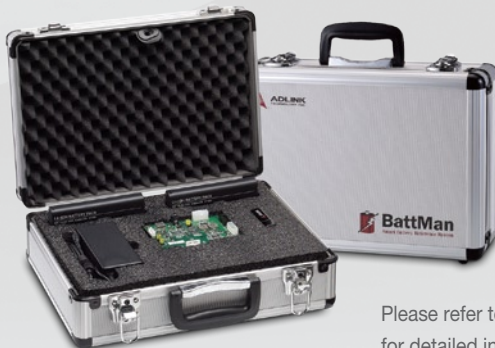
BattMan Smart Battery Management Reference System

Please refer to page 1-45 for detailed information