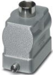
HEAVYCON B10 sleeve housing, for single locking latch, height: 72 mm, with 1 x Pg29 gland, straight cable outlet

Please be informed that the data shown in this PDF Document is generated from our Online Catalog. Please find the complete data in the user's documentation. Our General Terms of Use for Downloads are valid ( http://download.phoenixcontact.com )