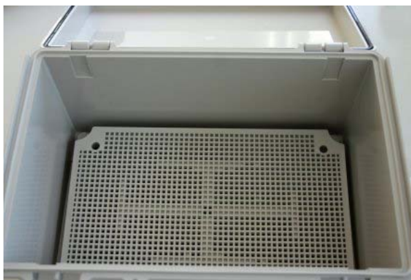
Click on Image for Larger View

An all plastic accessory panel used with the NBF series NEMA boxes that allows easy mounting of electronic devices in the box