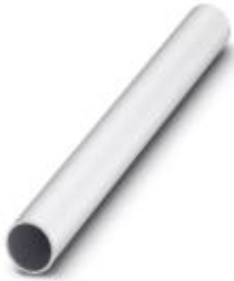
Tube, 400 mm long, Ø 25 mm

Please be informed that the data shown in this PDF Document is generated from our Online Catalog. Please find the complete data in the user's documentation. Our General Terms of Use for Downloads are valid ( http://phoenixcontact.com/download )