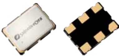
7.0 x 5.0mm Ceramic SMD