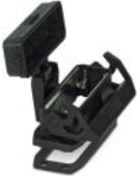
HEAVYCON EVO panel mounting base, plastic, D25, with single locking latch, flat gasket, and protective cover

Please be informed that the data shown in this PDF Document is generated from our Online Catalog. Please find the complete data in the user's documentation. Our General Terms of Use for Downloads are valid ( http://phoenixcontact.com/download )