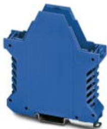
Component housing, Lower part, color: blue

Please be informed that the data shown in this PDF Document is generated from our Online Catalog. Please find the complete data in the user's documentation. Our General Terms of Use for Downloads are valid ( http://phoenixcontact.com/download )