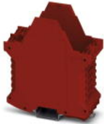
Component housing, color: red

Please be informed that the data shown in this PDF Document is generated from our Online Catalog. Please find the complete data in the user's documentation. Our General Terms of Use for Downloads are valid ( http://phoenixcontact.com/download )