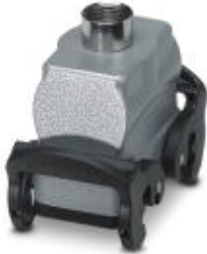
HEAVYCON B10 coupling housing, with double locking latch, height: 62 mm, with 1 x Pg16 gland, straight cable outlet

Please be informed that the data shown in this PDF Document is generated from our Online Catalog. Please find the complete data in the user's documentation. Our General Terms of Use for Downloads are valid ( http://phoenixcontact.com/download )