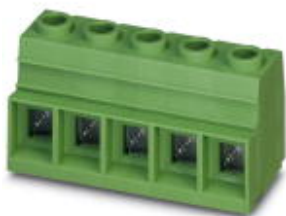
The figure shows a 5-pos. version of the product

Please be informed that the data shown in this PDF Document is generated from our Online Catalog. Please find the complete data in the user's documentation. Our General Terms of Use for Downloads are valid ( http://phoenixcontact.com/download )