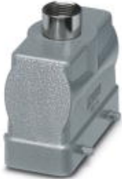
HEAVYCON B16 sleeve housing, for double locking latch, height: 65 mm, with 1 x Pg21 gland, straight cable outlet

Please be informed that the data shown in this PDF Document is generated from our Online Catalog. Please find the complete data in the user's documentation. Our General Terms of Use for Downloads are valid ( http://download.phoenixcontact.com )