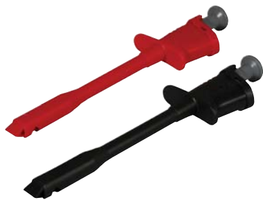
CT3045 (see model numbers above)

Copyright © 2007, Cal Test Electronics, Inc. All rights reserved. Information in this publication supersedes that in all previously published material. Trade names referenced are the service marks, trademarks or registered trademarks of their respective companies.