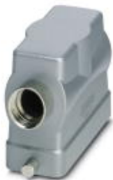
HEAVYCON B16 sleeve housing, for single locking latch, height: 76 mm, with 1 x M25 gland, lateral cable outlet

Please be informed that the data shown in this PDF Document is generated from our Online Catalog. Please find the complete data in the user's documentation. Our General Terms of Use for Downloads are valid ( http://phoenixcontact.com/download )