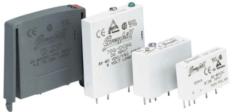
70L-IDC 70G-IDC 70-IDC 70M-IDC