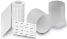
The figure shows the EML (20X8)R product variant

Label, Roll, white, unlabeled, can be labeled with: THERMOMARK ROLL, THERMOMARK ROLL X1, THERMOMARK X, THERMOMARK S1.1, Mounting type: Adhesive, Lettering field: 100 x 40 mm