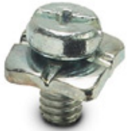
PE screw, for HC-HS contact inserts

Please be informed that the data shown in this PDF Document is generated from our Online Catalog. Please find the complete data in the user's documentation. Our General Terms of Use for Downloads are valid ( http://download.phoenixcontact.com )