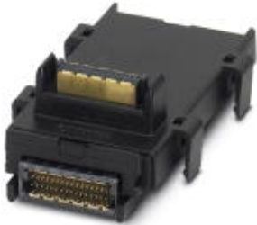
Axioline F bus base module for housing type F

Please be informed that the data shown in this PDF Document is generated from our Online Catalog. Please find the complete data in the user's documentation. Our General Terms of Use for Downloads are valid ( http://phoenixcontact.com/download )