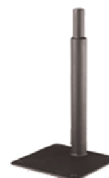
Model: 960-09 Mount Stand, 9" (203.2mm)

Click on any of the above images to find out more about the products pictured.