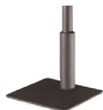
Model: 960-06 Mount Stand, 6" (127mm)