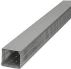
Cable duct, gray, consisting of upper and lower part, width: 30 mm, height: 100 mm, length 2000 mm

Please be informed that the data shown in this PDF Document is generated from our Online Catalog. Please find the complete data in the user's documentation. Our General Terms of Use for Downloads are valid ( http://phoenixcontact.com/download )