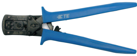
Crimping Tool, PN 6-1579014-8