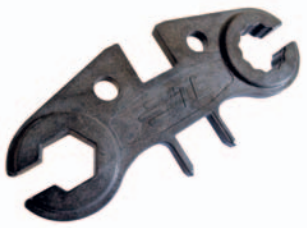
Field Tool - multiple functions, PN 1971903-1