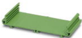
The figure shows the variant UM 45-Profil CM

Drawn section panel mounting base, with a constructional width of 108 mm and a fixed length of 200 cm