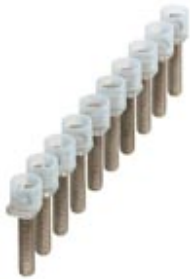
Bridge bar isolator, Number of positions: 10, Color: silver

Please be informed that the data shown in this PDF Document is generated from our Online Catalog. Please find the complete data in the user's documentation. Our General Terms of Use for Downloads are valid ( http://download.phoenixcontact.com )