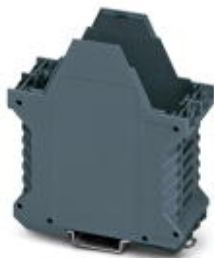
Component housing, length: 99 mm, Lower part, color: blue-gray, width: 45 mm

Please be informed that the data shown in this PDF Document is generated from our Online Catalog. Please find the complete data in the user's documentation. Our General Terms of Use for Downloads are valid ( http://phoenixcontact.com/download )