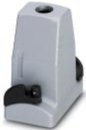
HEAVYCON ADVANCE EMV sleeve housing B6, with bayonet locking, height 100 mm, with 1xM25 thread, straight cable outlet

Please be informed that the data shown in this PDF Document is generated from our Online Catalog. Please find the complete data in the user's documentation. Our General Terms of Use for Downloads are valid ( http://download.phoenixcontact.com )