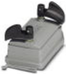
HEAVYCON ADVANCE IP65 protective cover B6, with bayonet locking, with retaining cord, diameter of retaining cord eyelet 3 mm

Protective covers - HC-B 6-TMB-SD-IP65 - 1690930