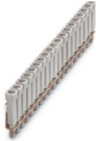
Jumper, Number of positions: 100, Color: gray

Please be informed that the data shown in this PDF Document is generated from our Online Catalog. Please find the complete data in the user's documentation. Our General Terms of Use for Downloads are valid ( http://download.phoenixcontact.com )