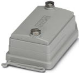
HEAVYCON ADVANCE, IP66, B10 protective cover for panel mounting side, with screw locking, with retaining cord, diameter of retaining cord eyelet: 3 mm

Please be informed that the data shown in this PDF Document is generated from our Online Catalog. Please find the complete data in the user's documentation. Our General Terms of Use for Downloads are valid ( http://phoenixcontact.com/download )