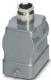
HEAVYCON B6 sleeve housing, for single locking latch, height: 56 mm, with screw connection, 1 x Pg13.5 gland, straight cable outlet

Please be informed that the data shown in this PDF Document is generated from our Online Catalog. Please find the complete data in the user's documentation. Our General Terms of Use for Downloads are valid ( http://phoenixcontact.com/download )