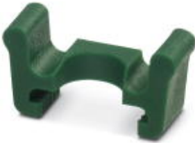
Replacement limit stop

Please be informed that the data shown in this PDF Document is generated from our Online Catalog. Please find the complete data in the user's documentation. Our General Terms of Use for Downloads are valid ( http://download.phoenixcontact.com )