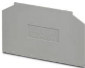
Partition plate, Length: 69 mm, Width: 1.5 mm, Height: 57 mm, Color: gray

Please be informed that the data shown in this PDF Document is generated from our Online Catalog. Please find the complete data in the user's documentation. Our General Terms of Use for Downloads are valid ( http://download.phoenixcontact.com )