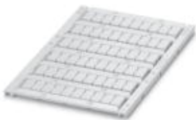
The figure shows the UCT-TM 6 version

UniCard materials for thermal transfer printer, for labeling Weidmüller, Conta Clip, and Klemsan terminal blocks, 60-section, can be labeled with THERMOMARK CARD and BLUEMARK LED, color: white