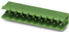
The figure shows a 10-position version of the product

Header, Nominal current: 12 A, Rated voltage (III/2): 320 V, Number of positions: 17, Pitch: 5 mm, Color: green, Contact surface: Tin, Assembly: Soldering