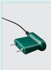
MO290-P Moisture Pin Probe