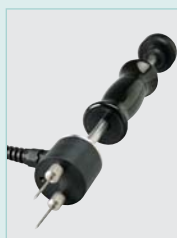
MO290-HP Moisture Hammer Probe