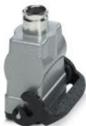
HEAVYCON B10 coupling housing, with single locking latch, height: 77.5 mm, with 1 x M25 screw connection, straight cable outlet

Please be informed that the data shown in this PDF Document is generated from our Online Catalog. Please find the complete data in the user's documentation. Our General Terms of Use for Downloads are valid ( http://phoenixcontact.com/download )