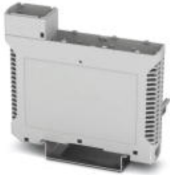
Housing base, for 10/10 bus connector, color: light gray

Please be informed that the data shown in this PDF Document is generated from our Online Catalog. Please find the complete data in the user's documentation. Our General Terms of Use for Downloads are valid ( http://phoenixcontact.com/download )